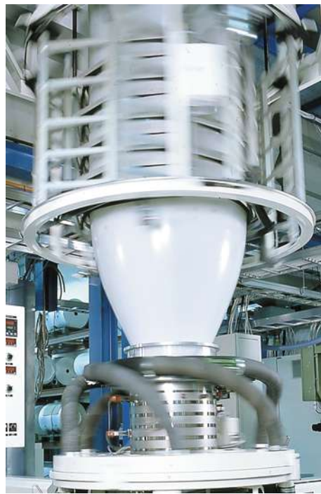
Pakkausmateriaalitehtaat vahvistavat läsnäoloamme päämarkkina-alueilla.