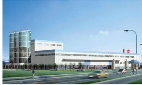
Elecster Aseptic Packaging Co. Ltd:n rakenteilla oleva tehdas Kiinassa.