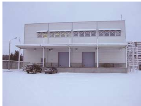
Elecster Oyj:n tytäryhtiön, OOO Finnpackin, pakkausmateriaalitehdas Venäjällä.