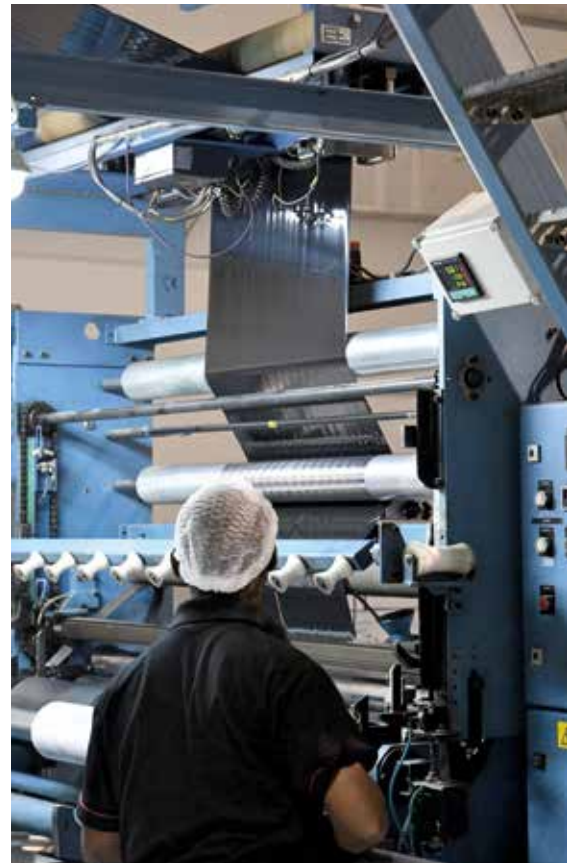
Kalvonajaja Elecster Kenian tehtaalla

Elecster-brändin tunnettuus yhdistettynä tuotteiden ja palveluiden paikalliseen saatavuuteen on tuonut positiivista virettä myös meijerikoneiden myyntiin alueella.